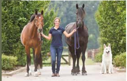
Docent Module Paard (Dier)Fysiotherapeute

“Van jongs af aan ben ik een groot dierenliefhebber. Al op hele jonge leeftijd wist ik dan ook dat ik met dieren wilde werken. Ik heb zelf een passie voor de paardensport en kom op dit moment uit in de M2 dressuur.