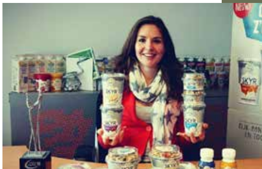
Docent Marketing Brandmanager & Marketeer