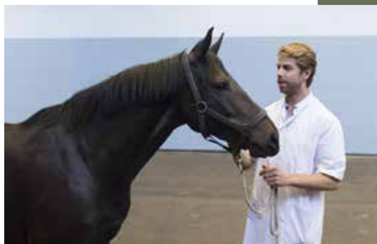
Docent Module Paard DVM, Diplomate ECVS, FES Certified en Diplomate ACVSMR